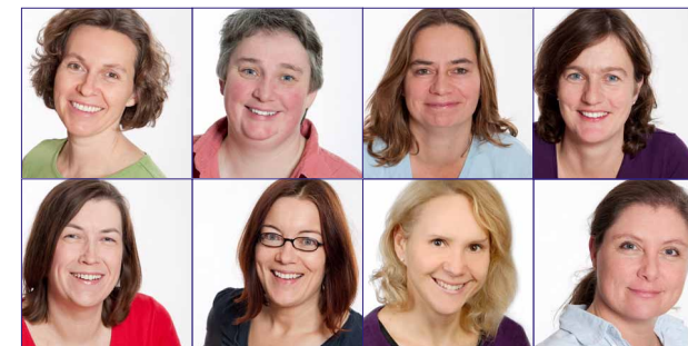
Ihr PotsKids! Team

AGB: Unsere Allgemeinen Geschäftsbedingungen finden Sie unter www.potskids.de .